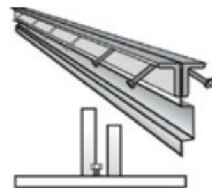
RECOSTAL® Keyboard XLW